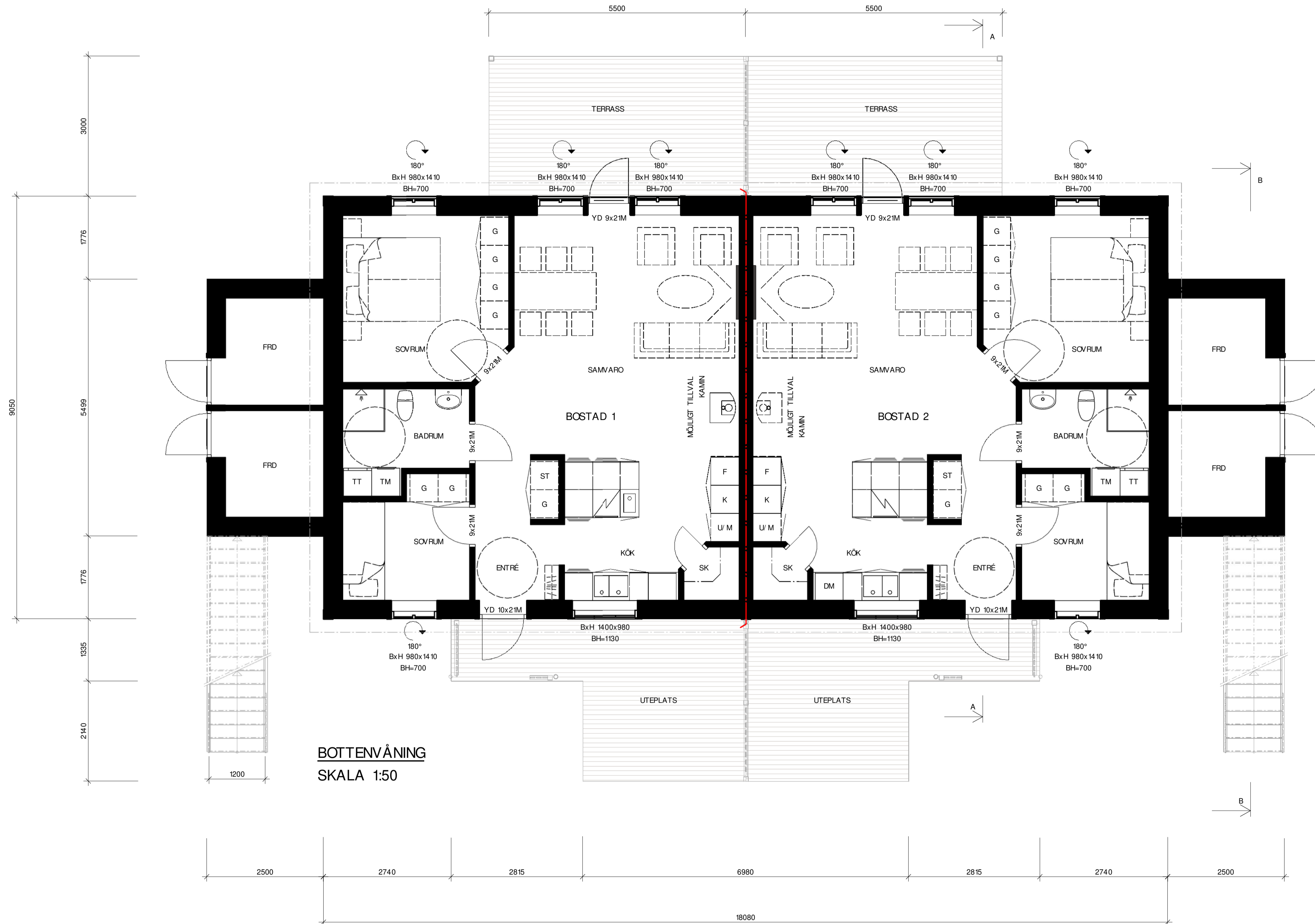
BOTTENVÅNING SKALA 1:50

SE FÖR PROJEKTET UPPRÄTTAD RITNINGSFÖRTECKNING.