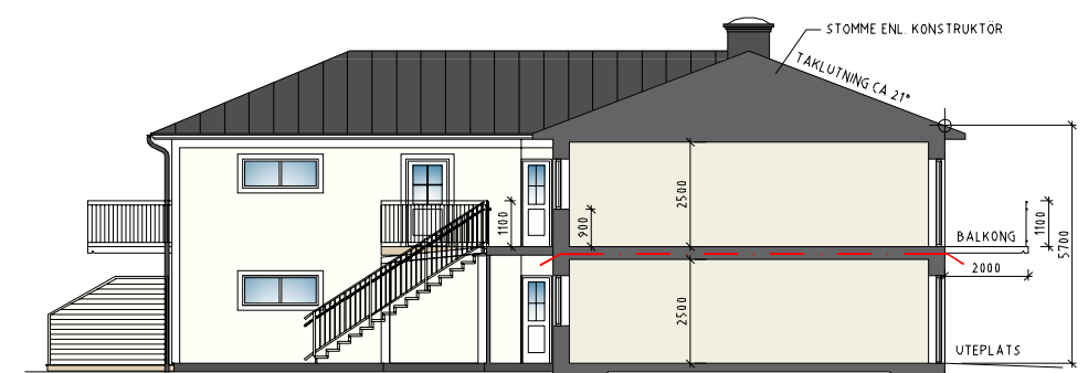
INNERFASAD MOT SÖDER & PRINCIPSEKTION A-A